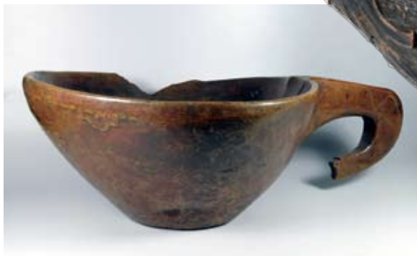
Peniķu kauss un kausa rokturis no Ķoniņciema