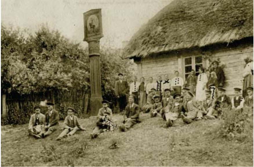
Ķoniņiemā pie Peniķu staba. 20. gs. sākums