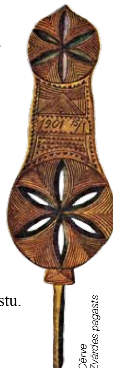
Cērve Zvārdes pagasts