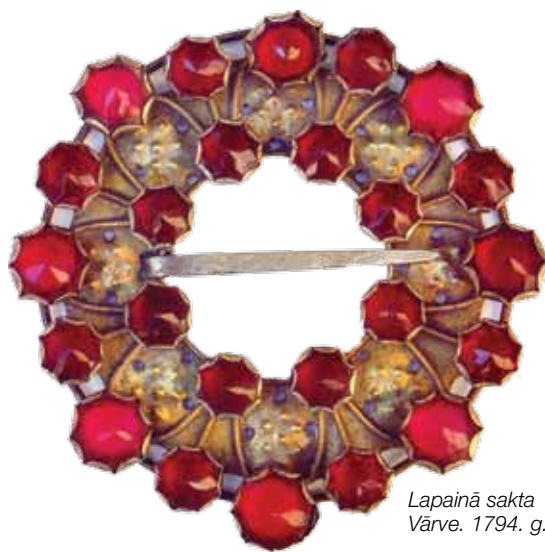
Lapainā sakta Vārve. 1794. g.

Trīs puķītes skaisti zied Ķezberīšu dārziņā: Viena ieva, otr' ābele, Trešā pate ķezberīte. Sēlpils