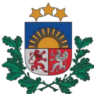
LV mazais ģerbonis ar ozola zariem

lodveida izaugumi, kurus pārplēšot var ieraudzīt mazus, baltus kāpurus vai, jau rudens pusē, nobriedušu nelielu panglapsenīti. Dažas panglapseņu sugas veido mazākas lodveida vai diskveida pangas uz lapu apakšpuses, citas – sūkļveida iepaļus bumbuļus dzinumu galos, vēl kādas ieviešas pumpuros un izraisa to nesamērīgu augšanu. Mitrākās vasarās ozolu lapas bojā arī miltrasa . Tomēr neviena no minētajām kaitēm nav atzīstama par mirstamo vainu . Tiesa, līdzīgi kā vīksnām, gobām un ošiem pēdējos gados arī ozoliem konstatēti jauni slimību izraisītāji.