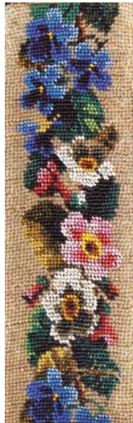
Zīļu josta. Misa. 19. gs. 2. p.

Dziedot piedziedājumu, vidējais rotaļnieks uzlūdz kādu no dārziņa un tecinūs soļiem griežas pārmaiņus labajos un kreisajos elkoņos. Piedziedājuma laikā dārziņš turpina iet dejas ceļa virzienā. Sākoties nākamajam pantam, vidū paliek uzlūgtais rotaļnieks, bet uzlūdzējs nostājas dārziņā. Dārziņa kustība nevienu brīdi netiek pārtraukta.