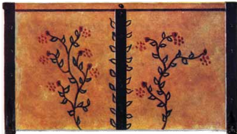
Pūra lāde. Bērzaunes pagasts