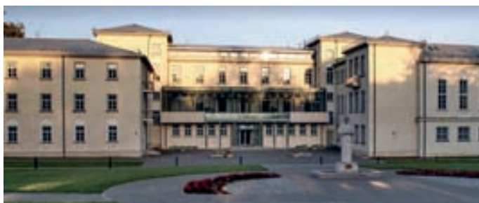
Rēzeknes Tehnoloģiju akadēmija

1993. gada 1. jūlijā uz Latvijas Universitātes un Rīgas Tehniskās universitātes Rēzeknes filiāļu bāzes izveidoja Rēzeknes Augstskolu. 2002. gadā pie Rēzeknes Augstskolas ēkas atklāja pieminekli Latgales Atmodas kustības darbiniekam N. Rancānam, bijušajam Rēzeknes Valsts Skolotāju institūta direktoram. 2016. gadā augstskolu pārdēvēja par Rēzeknes Tehnoloģiju akadēmiju.