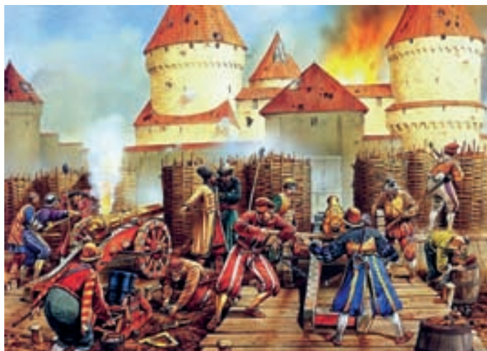
Livonijas karš: Cēsu kauja

Livonijas karš ilga 25 gadus, tas bija visilgākais karš Krievijas vēsturē un beidzās ar Krievijas sakāvi. Kā liecina vēsture, Livonijas karš bija Ivana Bargā valdīšanas galvenais jautājums un kara neveiksme kļuva par viņa dzīves traģēdiju. Pēc Ivana Bargā nāves Krievijā iestājās juku laiki. Apsteidzot notikumu gaitu, der piezīmēt, ka līdzīgs vēstures posms Latvijas teritorijā bija pēc 350 gadiem (1917–1920), kad par Latvijas teritoriju cīnījās trīs lielvaras – Krievija, Lielbritānija un Vācija, kā arī Polija un Lietuva.