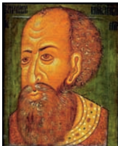
Ivans Bargais (tā sauktais Kopenhāģenas portrets)

1558. gadā aizsākās jauna Eiropas vēstures lappuse: Ivans Bargais cauri Livonijai mēģināja bruģēt Krievijai ceļu uz jūru. Pirms tam viņš 1552. gadā veiksmīgi iekaroja Kazaņu, pēc četriem gadiem – 1556. gadā sakāva arī Astrahaņas hana valsti. Ivans Bargais bija pārliecināts par maskaviešu spēku, bet rupji kļūdījās, nepareizi novērtējot starptautisko situāciju un nesaskatot to, ka pārējās Livonijas kaimiņvalstis arī vēlēšies iedzīvoties uz tās rēķina.