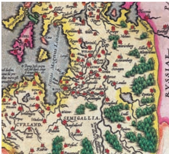
Ivana Bargā krievu karaspēks, iedams pāri Livonijai, to pilnībā izpostīja (atzīmēts ar uguns kuriem), bet Rīgu neieņēma