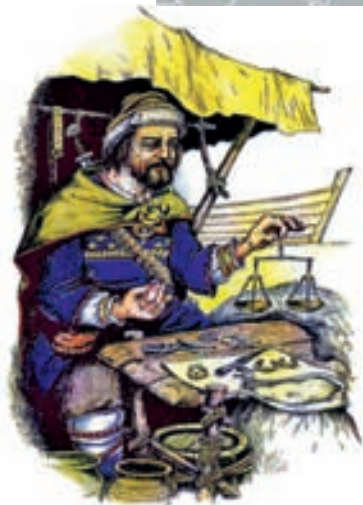
Latgaļu tirgotājs 10.–11. gadsimtā (A. Liepiņa rekonstrukcija)

8. gadsimtā, veidojoties tirdzniecības sakariem, arī Latvijas teritorijā sudraba dirhēms kļuva par vietējo naudu. Jau 18. gadsimtā tika atrastas sudraba monētas ar iekaltām korāna vārsēm. Latvijā oficiāli ir atrastas 2400 arābu monētas, kā arī atrasti apbedījumi ar uzrakstiem arābu valodā.