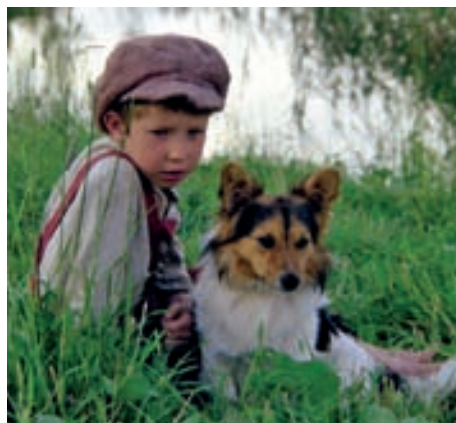
Kadrs no filmas “Cilvēka bērns”

1944. gadā Klīdzējs ar sievu dodas prom no Latvijas, no sākuma nonāk Vācijā, pēc tam 1950. gada jūnijā ASV, kādu laiku uzturoties Čikāgā. 1953. gadā Klīdzēju ģimene apmetas uz dzīvi Napas ielejā, Kalifornijā. Klīdzējs sākotnēji strādā fizisku darbu, gan par gurķu skābētāju, gan koku zaru retinātāju. 1957. gadā ieguvis maģistra grādu klīniskajā socioloģijā Berklejas universitātē, turpmākos divdesmit gadus strādājis psihiatriskajā slimnīcā, līdz pensionēties 1977. gadā. Atrašanos prom no Latvijas Klīdzējs raksturojis kā trīs dzīvju dzīvošanu: reālo dzīvi amerikāniskajā vidē, trimdas latvieša dzīvi un zaudētās dzimtenes dzīvi.