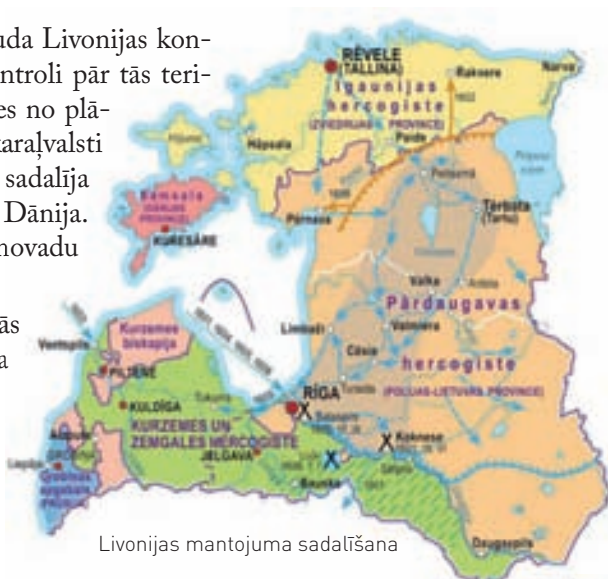
Livonijas mantojuma sadalīšana

Latgale praktiski nonāca poļu varā uz 200 gadiem – līdz 1772. gadam, kad šo teritoriju iekaroja Krievija.