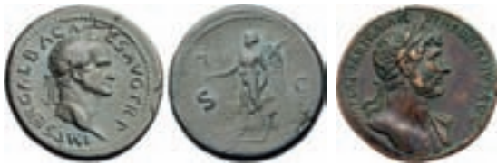
Romiešu bronzas monētas – sesterciji, kas lielā daudzumā atrasti Latvijas teritorijā

Eversmuižas depoziāts ir ne tikai vislielākais šī perioda, bet arī visbagātākais Latvijas depoziāts ģeogrāfiskā areāla ziņā: tajā ir divas romiešu monētas, arābu dirhēmi, vācu, anglosakšu, īru, zviedru un Bohēmijas denāri, Skandināvijas atdarinājumi. Pašas agrākās depoziātā bija romiešu monētas.