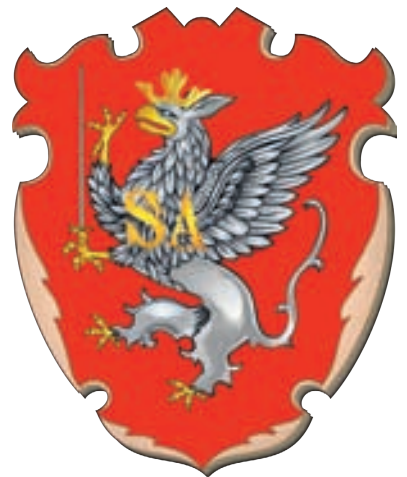
Inflantijas ģerbonis ar Sigismunda II Augusta iniciāļiem

Apgabali uz austrumiem no Aiviekstes un Pededzes tomēr atšķirās no apgabaliem uz rietumiem. Austrumu apgabali bija retāk apdzīvoti, un te bija lielāki meži, daudz ezeru un purvu. Šie apstākļi izšķīra Latgales rašanos. 17. gadsimta karu lielākā problēma bija karaspēka apgāde. To atrisināja, rekvizējot pārtiku, apģērbu un transporta līdzekļus no zemniekiem kaujas lauku tuvumā. Kad kāds apgabals bija izpostīts, karaspēku pārcēla uz citu vietu. 1625. gadā zviedri okupēja Latgali, bet izrādījās, ka apgādes grūtības šai maz apdzīvotajā zemē, kurā turklāt nebija ceļu, bija tik lielas, ka jau gada beigās zviedriem Latgali vajadzēja atstāt. Pēc tam karš norisinājās Vidzemē un Zemgalē. Izņēmums bija 1627. gadā zviedru ekspedīcija uz Dinaburgu, bet apgādes grūtību dēļ zviedriem atkal bija jāatkāpjas uz Vidzemi.