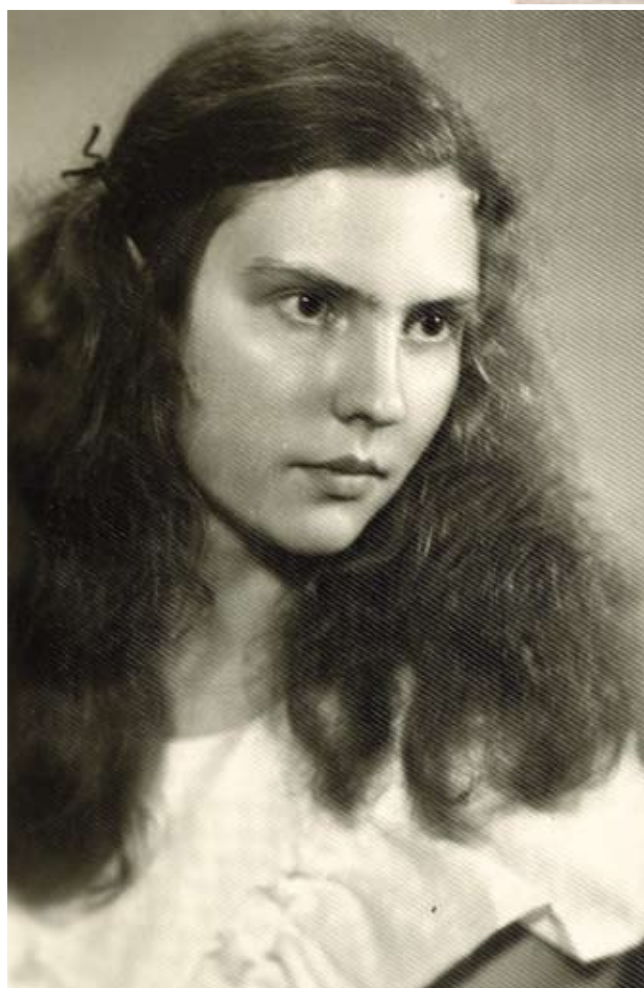
Beidzot vidusskolu. 1972. gads. Secondary school finished. 1972.