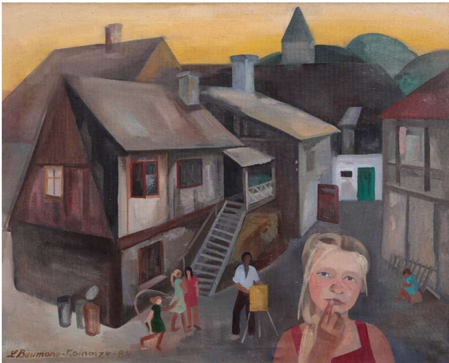
Māja Aizputē. 1984. Audekls/eļļa. 81 x 100 cm