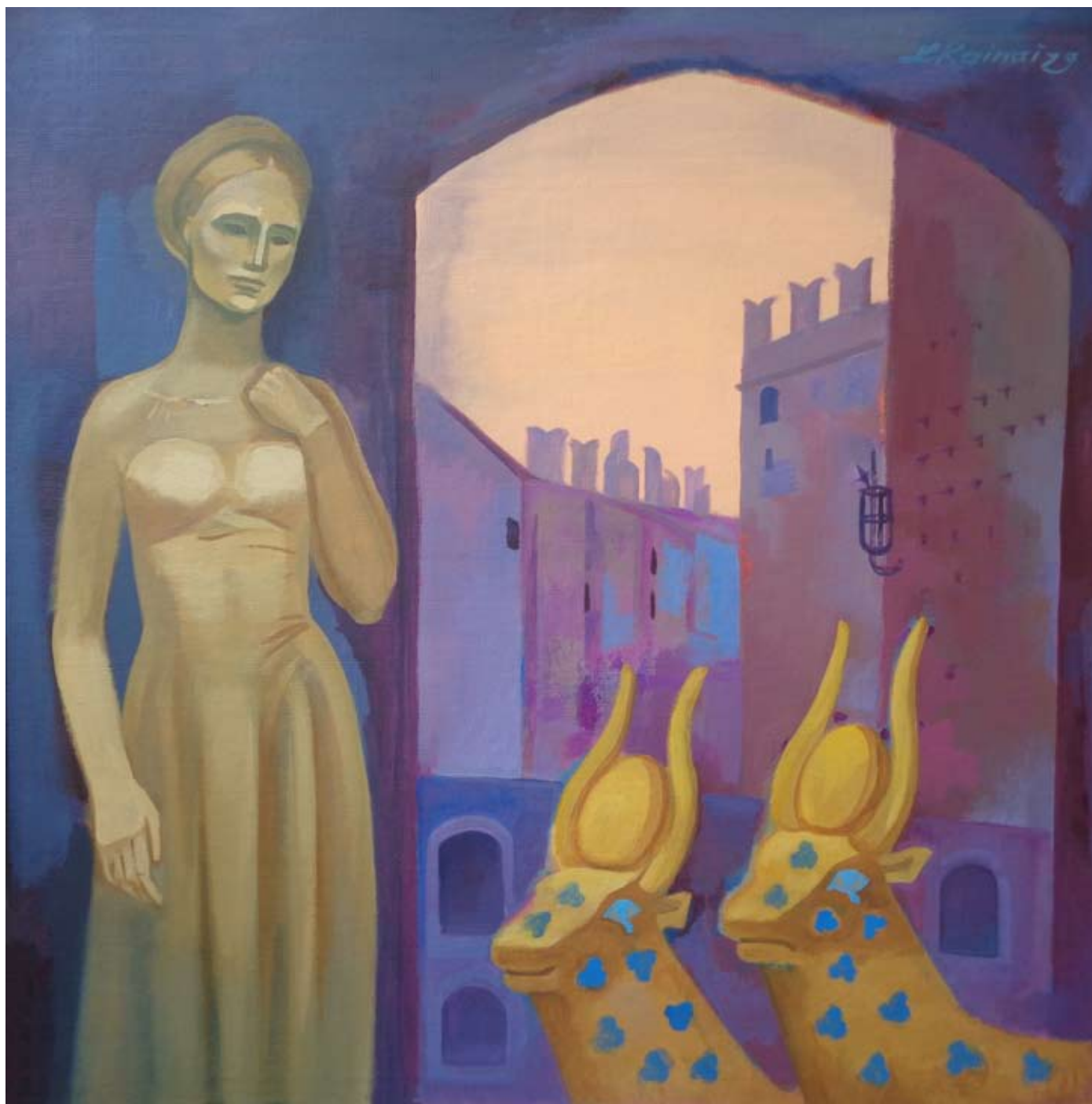
Senā Verona. 2023. Audekls/eļļa. 100 x 100 cm Ancient Verona. 2023. Canvas/oil. 100 x 100 cm