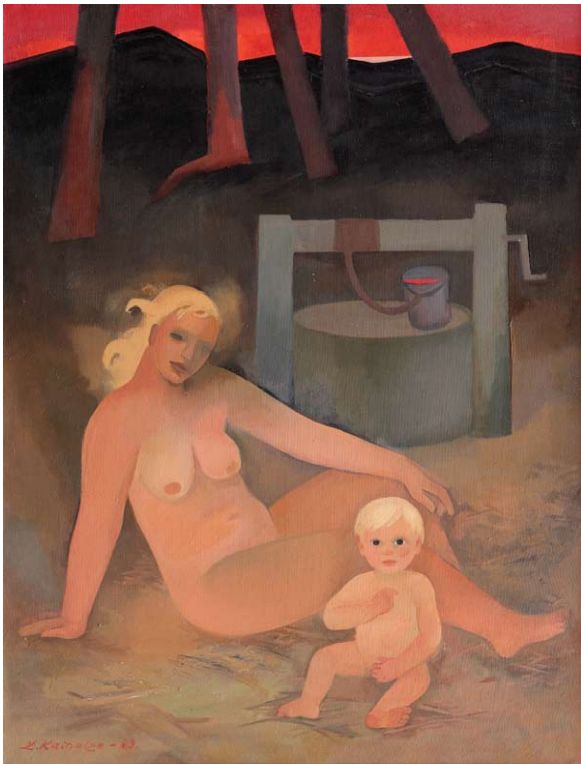
Dzintais krasts. 1989. Audekls/eļļa. 130 x 100 cm Home coast. 1989. Canvas/oil. 130 x 100 cm